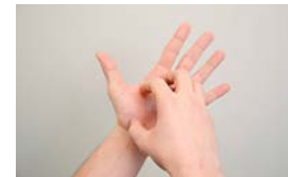
Handpalmen en vingertoppen