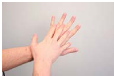
Tussen de vingers